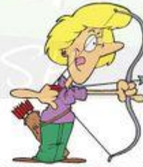
TIRO CON ARCO